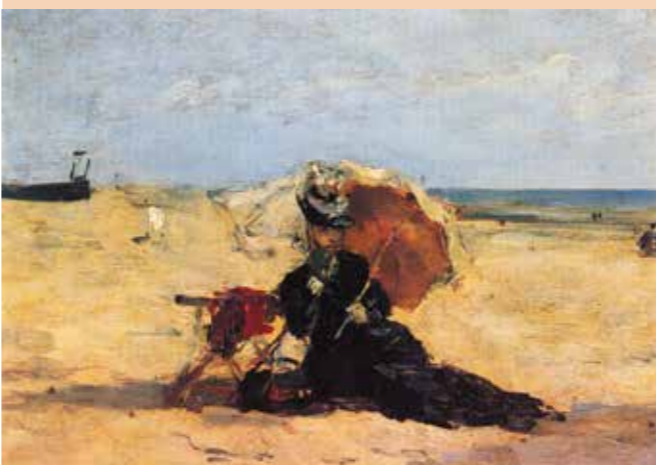
Femme à l'ombrelle sur la plage de Berck; Eugène Boudin

Propone 1200m 2 de exposición permanente: Eugène Boudin y los pintores del estuario de los Siglos XIX y XX (Boudin, Monet, Saint-Denis, Isabey, Dubourg...), estudio de dibujos, colección de tocados, trajes de normandos y sala de exposiciones temporales.