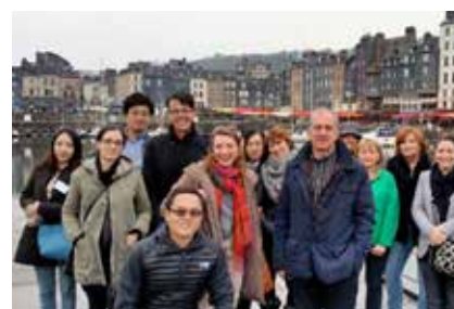
Accueil de voyageurs et de journalistes étrangers pour les Rendez-vous France

En 2019, l'Office de Tourisme était présent au Salon des Vacances de Bruxelles, aux Fêtes Normandes d'Evreux (grand public), ainsi qu'au Seatrade Cruise Global de Miami (USA) et au Seatrade Europe de Hambourg (Allemagne). Ces derniers sont les plus grands salons professionnels du marché de la croisière. L'Office de Tourisme a également participé à un workshop au Canada, à un workshop à Nîmes à destination de la clientèle du bassin méditerranéen, à un workshop Allemagne et à un workshop à destination des comités d'entreprises. Enfin, l'Office de Tourisme a participé aux Rendez-Vous France (le plus grand salon professionnel à destination des prescripteurs de voyages étrangers) et a participé à l'accueil de ces professionnels, à Honfleur, en amont du salon.