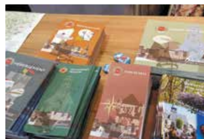
Documentation proposée par l'Office de Tourisme lors du Salon des Vacances

Cette documentation est gratuitement mise à la disposition des visiteurs, à la demande à l'accueil de l'Office de Tourisme et téléchargeable sur le site internet de l'Office de Tourisme. En devenant partenaire, vous vous assurez ainsi une bonne visibilité sur tous ces supports de communication, avec, entre autre, des photos de votre établissement et tous les liens utiles pour être contacté par les touristes.