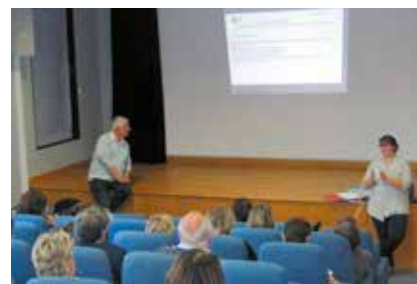
Réunion d'information sur l'accueil des PMR organisée pour nos partenaires