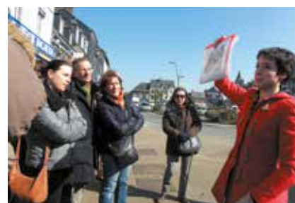
Visite guidée de Beuzeville lors d'un eductour organisé pour nos partenaires