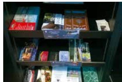
Présentoir en libre accès à l'accueil de l'Office de Tourisme

Votre documentation est mise en avant dans notre espace dédié aux partenaires et est à disposition de tous les visiteurs.